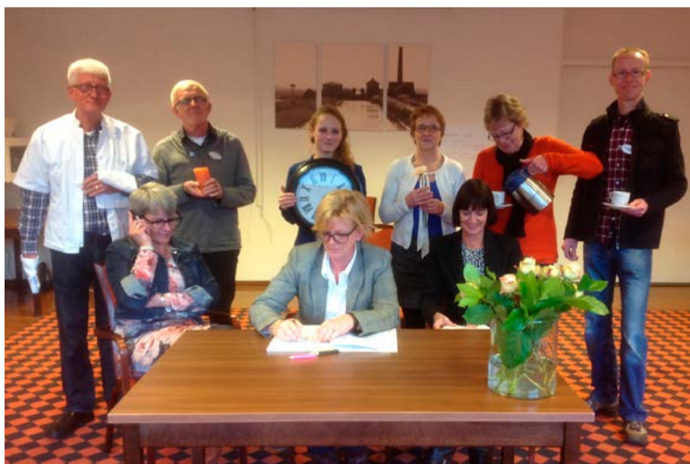
Vrijwilligers in opleiding ronden introductietraining af.

In 2013 hebben 51 vrijwilligers een training gevolgd bij het Landelijk Steunpunt VPTZ. Daarnaast is er een introductietraining gegeven aan nieuwe vrijwilligers. Deze trainingen zijn gefinancierd door een gezamenlijke subsidie van drie gemeenten in de regio, namelijk Nijkerk, Bunschoten en Putten. Het hospice is blij met deze bijdrage en met de unieke vorm van verbinding met deze regionale gemeenten.