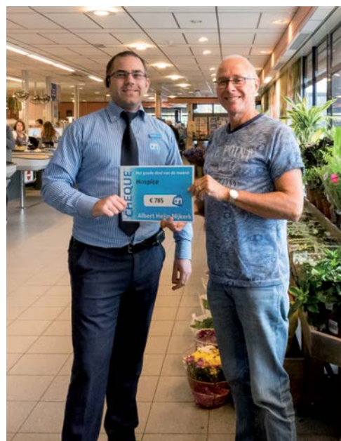
De lege-flessen-actie van AH Nijkerk bracht 785 euro op voor het hospice.

De Stichting Vrienden van Hospice Nijkerk is dankbaar voor de grote betrokkenheid van de sponsors en giftgevers.